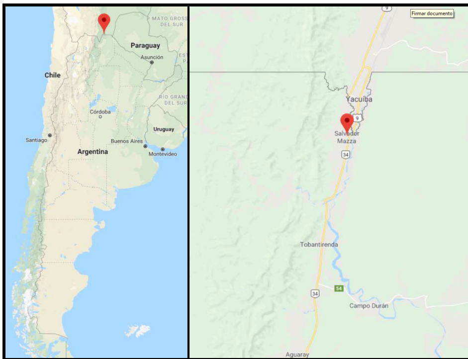
Figura 1. Localización de caso de rabia canina, Salvador Mazza, provincia de Salta. Argentina, 2018.